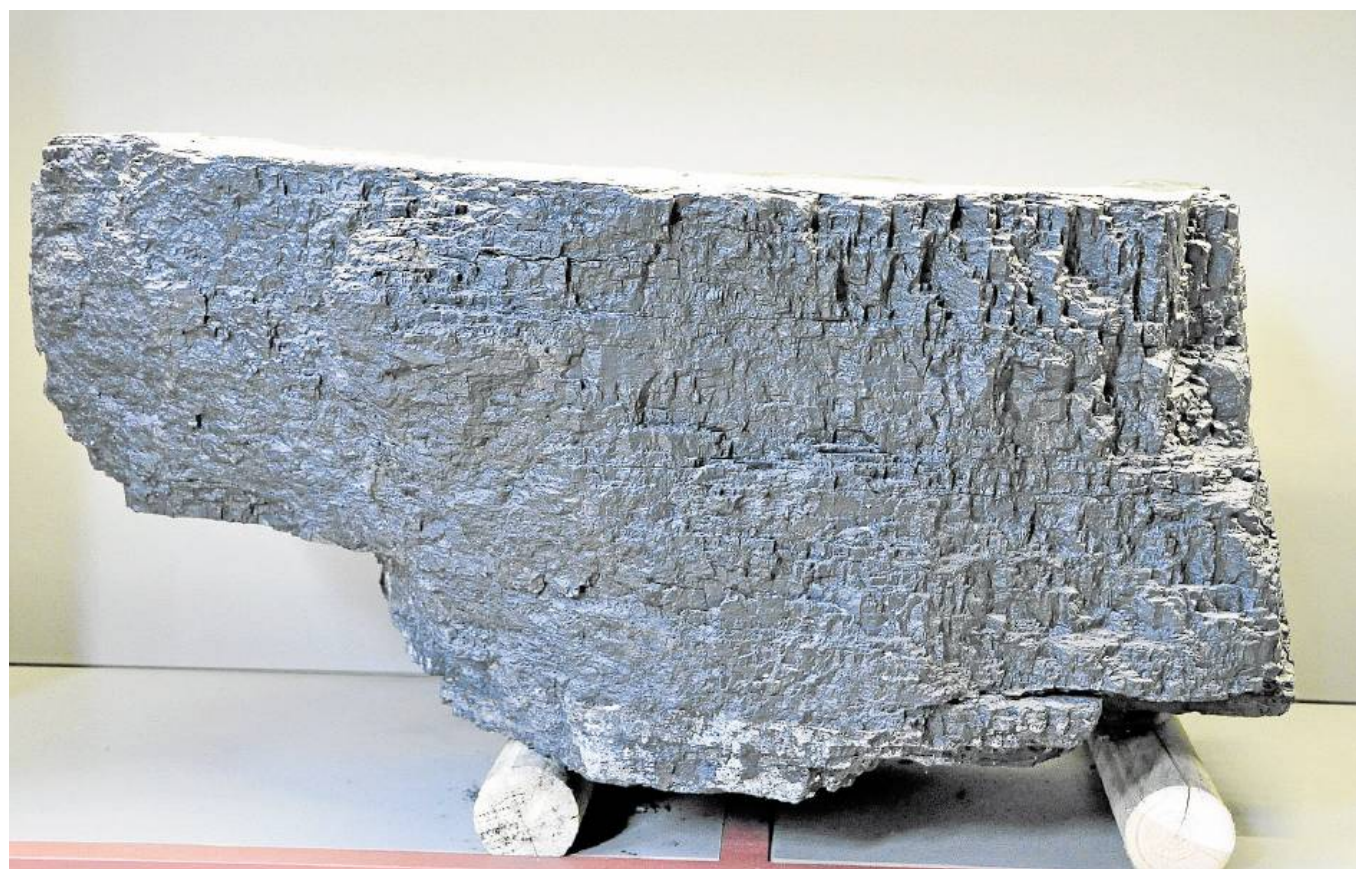
Im Licht des Ausstellungsregals glänzt der Kohlealtar silbrig-schwarz. Es brauchte viel Anstrengung und Überlegung, um den rund 250 Kilogramm schweren Koloss in einem Stück abzubauen und ans Tageslicht zu befördern.

Das neue Leopold-Hochregal zieht als attraktive Dauerausstellung in der Maschinenhalle Fürst Leopold auf dem ehemaligen Hervester Zechengelände große und kleine Besucher in den Bann. Jedes der 32 realen wie symbolischen Exponate in seinen Fächern weckt die Neugierde auf die Geschichte dahinter. In unserer Sommerserie „Leopoldregal“ drücken wir für Sie auf den Touchscreen des Terminals und liefern Ihnen neben Erklärungen zum Exponat auch noch Zusatzinfos von dem Bergbau-Experten Gerhard Schute.