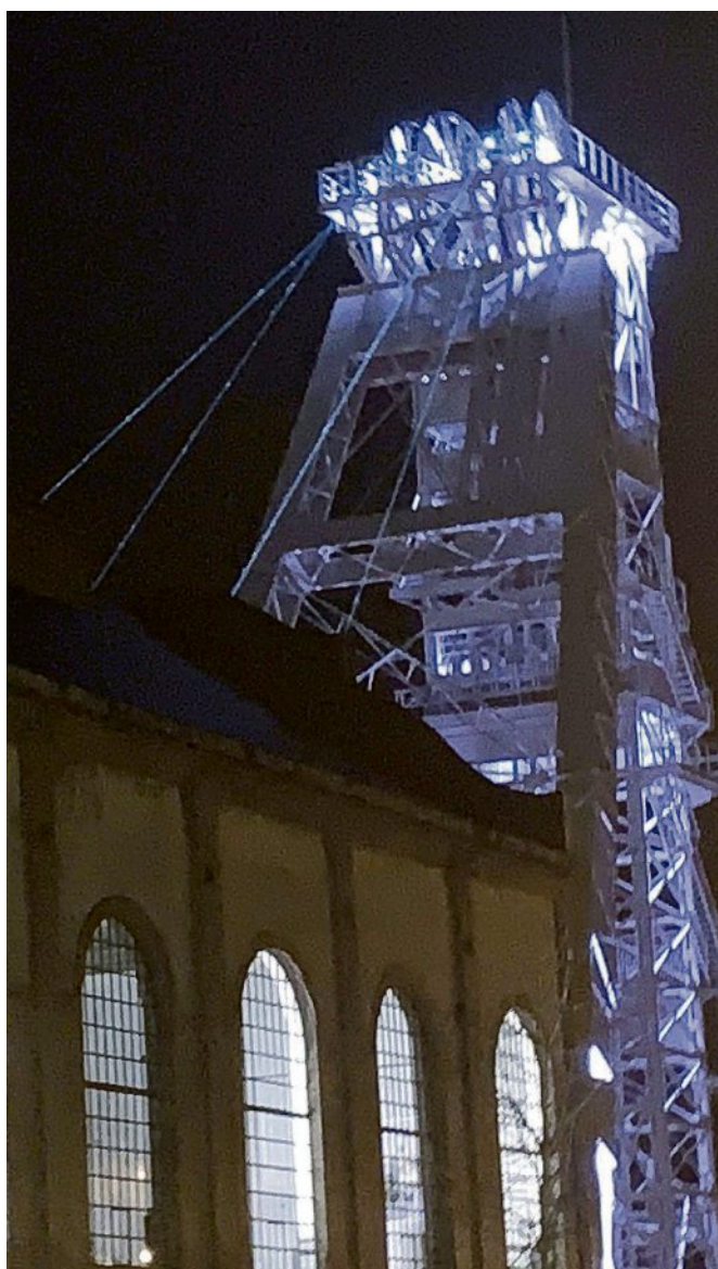
Auch die Laserstrahlen, die künftig vom Gerüst zur Maschinenhalle die vier Förderseile visualisieren sollen, waren zu sehen.

Vor allem, weil in Dorsten eine Besonderheit geplant