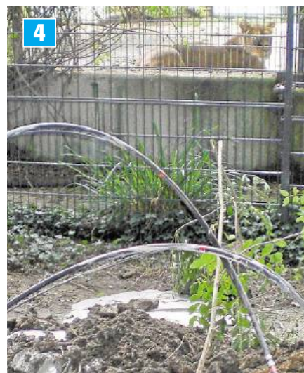
4 Ein Tagesbruch im Dortmunder Zoo: nur wenige Meter vorm Löwengehege.