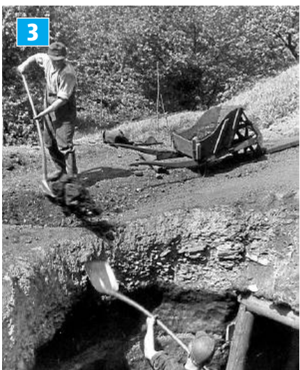
3 „Zeche Eimerweise“ im Muttental der 50er-Jahre. Davon gab es über 1000.