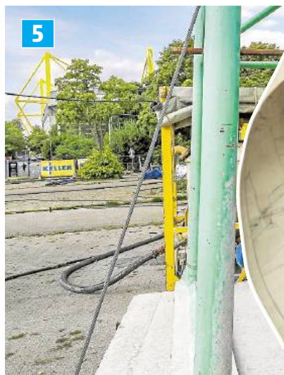
5 Am Signal Iduna Park fließt seit Wochen Beton in Hohlräume.