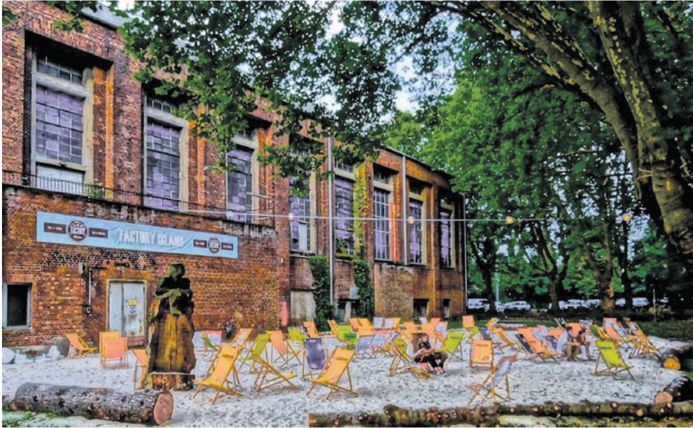
Ins Ex-Kesselhaus im Creativ-Quartier sollen Gastronomie und der Künstler Norbert Then mit Atelier einziehen.

Der Vertrag zwischen Ruhrstadt-Stiftung und dem asiatischen Gastronomen, der in Dortmund ein großes Büfett-Restaurant betreibt, sei unterschrieben. Der Umbau richtet