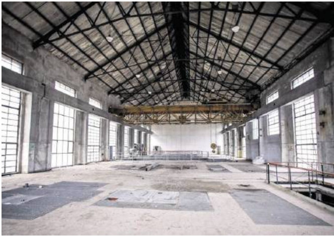
So zieht es im Obergeschoss des Kesselhauses aus.