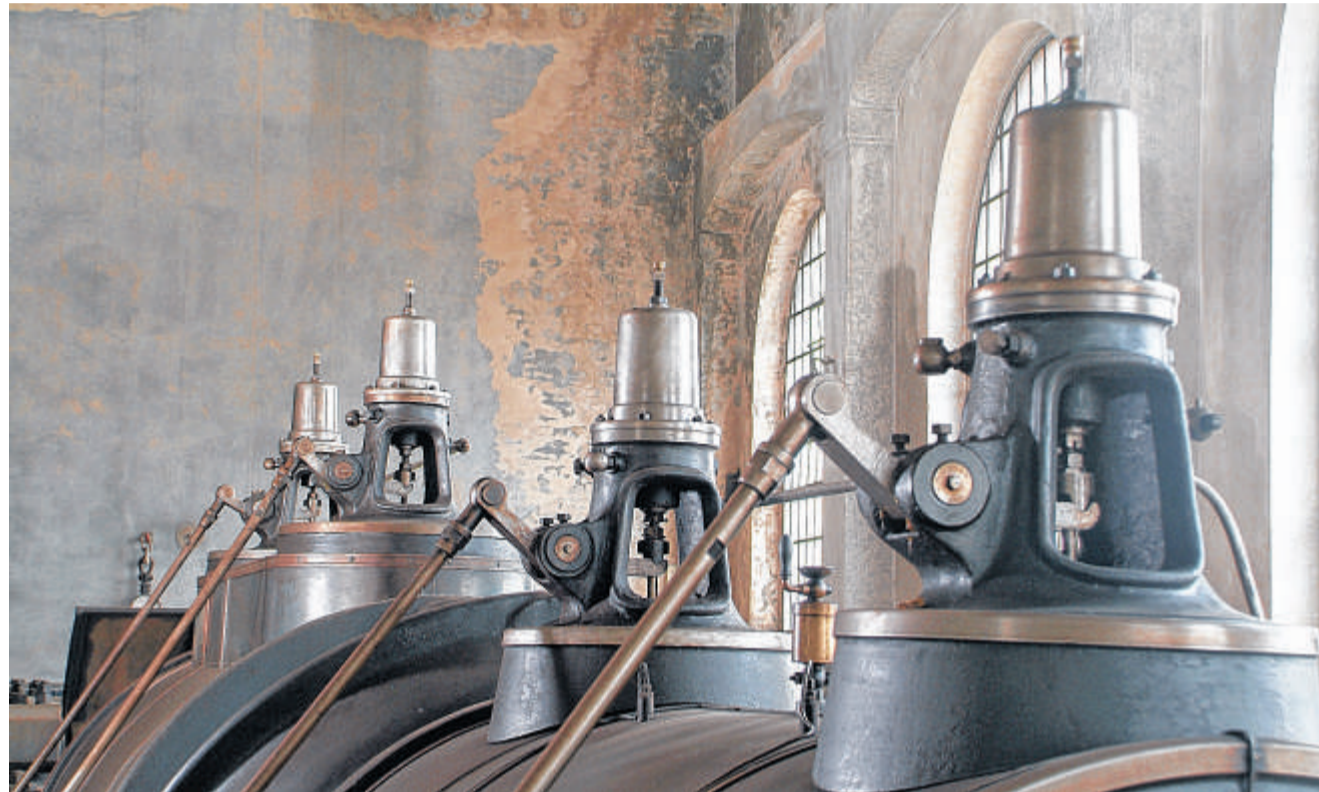
Mehr als 10 000 Arbeitsstunden investierte der Bergbauverein in die Schwarze Dampfmaschine.

Bergbauverein zur künftigen Nutzung der Maschinenhalle: Lernort, Trauungen und Kunst an der Dampfmaschine