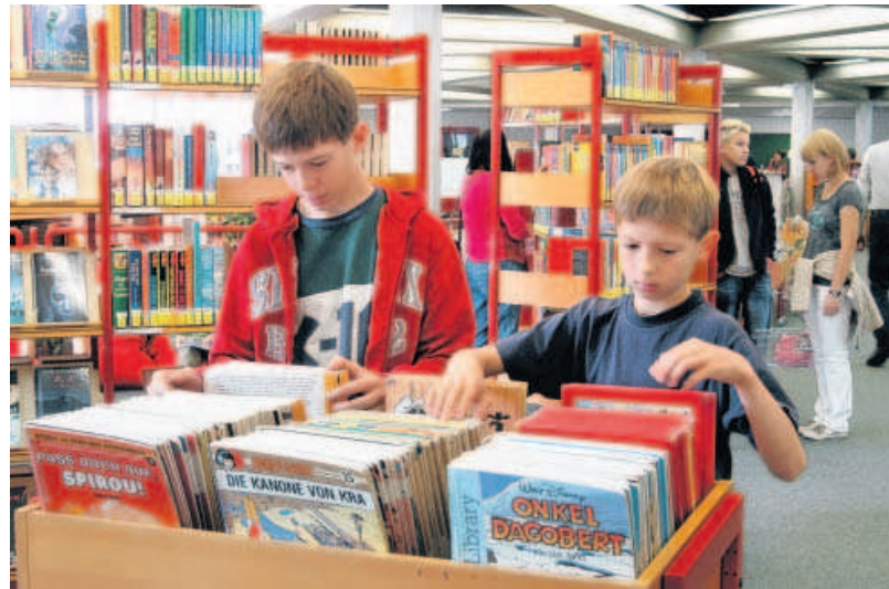
Die beliebte Comic-Kiste in der Kinderbuch-Abteilung der Stadtbibliothek.

Die Ausleihen je Einwohner nennt die GPA „weit über-